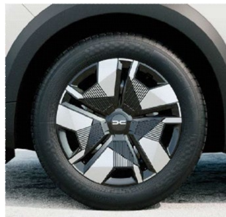
Τροχοί 16" "erelia" με δίχρωμο κάλυμμα & ελαστικά 205/60 R16