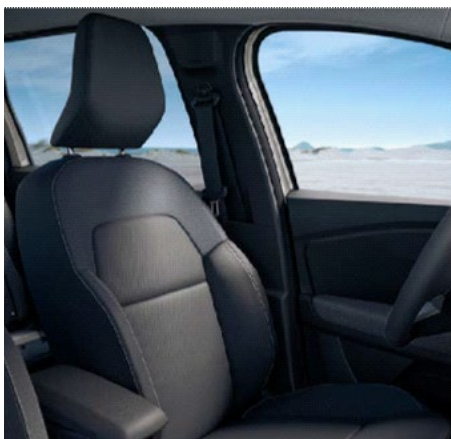
Υφασμάτινες επενδύσεις καθισμάτων σε μαύρο & μπλε Καργα χρώμα