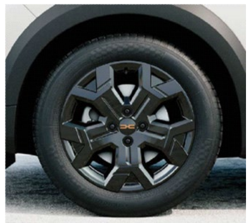
Ζάντες αλουμινίου 16" "ταμια black" & ελαστικά 205/60 R16