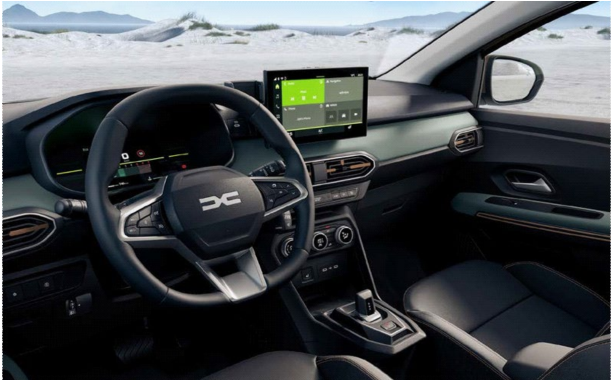
Ψηφιακός πίνακας οργάνων 7" & Σύστημα πολυμέσων Media Display 10,1"