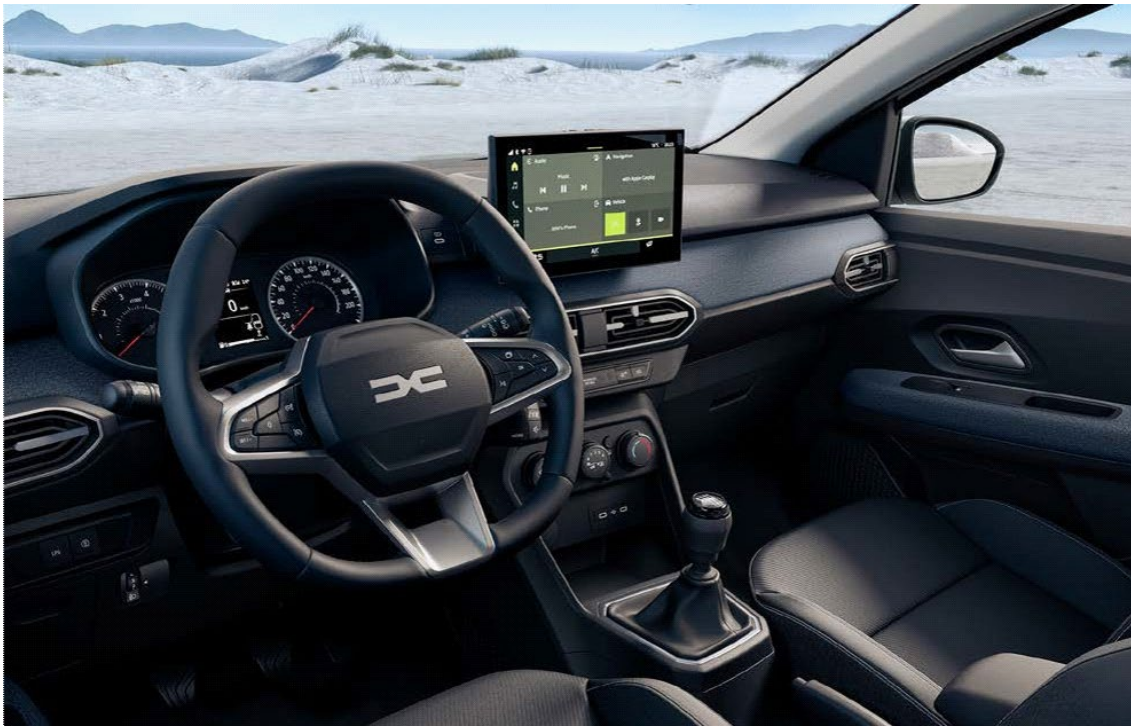
Πίνακας οργάνων με οθόνη TFT 3" & Σύστημα πολυμέσων Media Display 10,1"