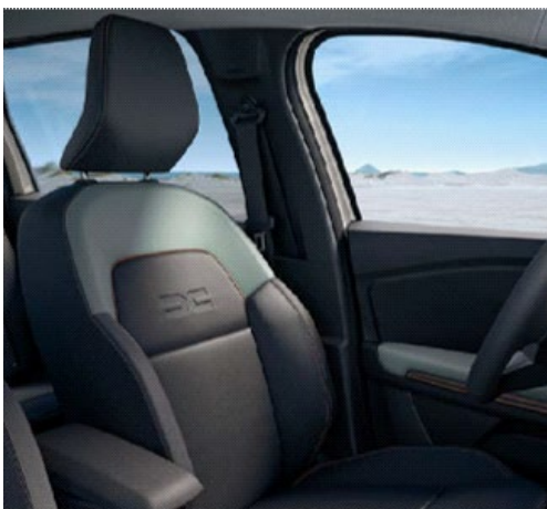
Επενδύσεις καθισμάτων MicroCloud σε μαύρο & χακί χρώμα