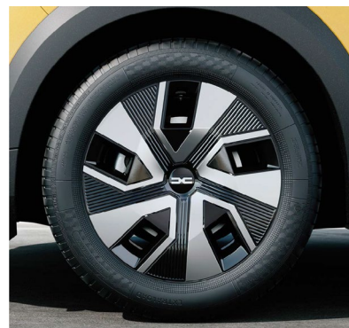
Τροχοί 16" & ελαστικά 205/60 R16