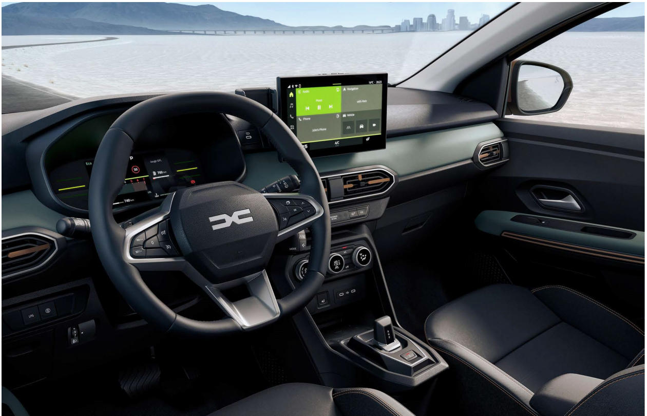
Ψηφιακός πίνακας οργάνων 3,5" & Σύστημα πολυμέσων Media Display 10,1"