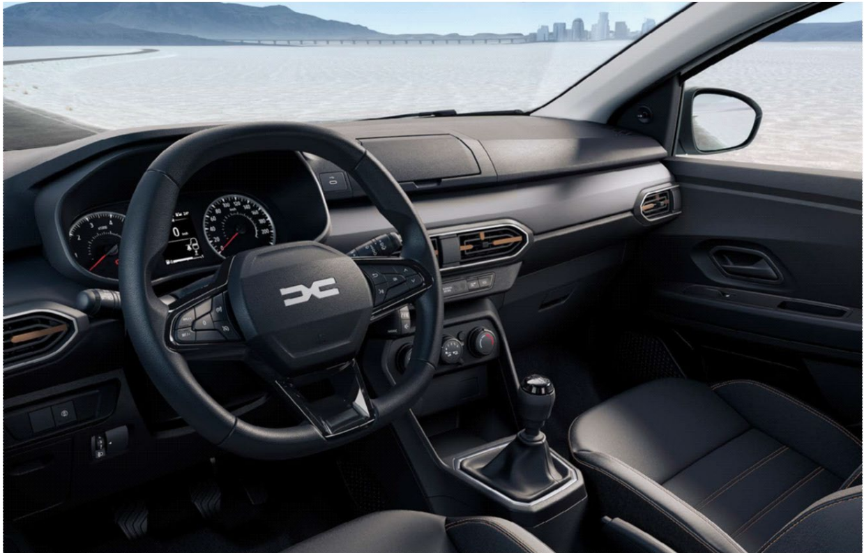
Πίνακας οργάνων με οθόνη 3,5" & Σύστημα πολυμέσων Media Control