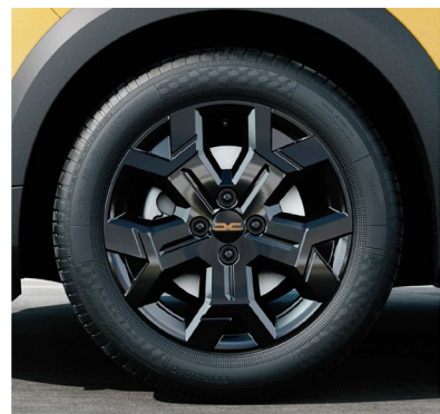
Τροχή 16" & ελαστικά 205/60 R16