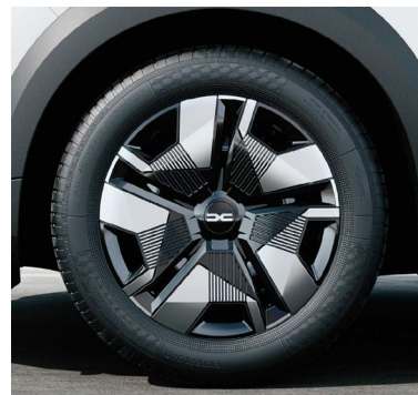
Τροχοί 16" & ελαστικά 205/60 R16