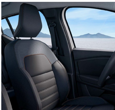
Υφασμάτινες επενδύσεις καθισμάτων