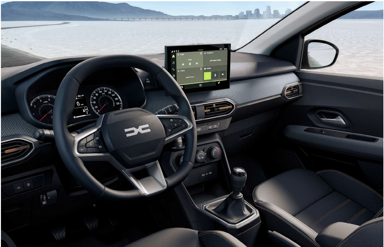
Ψηφιακός πίνακας οργάνων 3,5" & Σύστημα πολυμέσων Media Display 10,1"