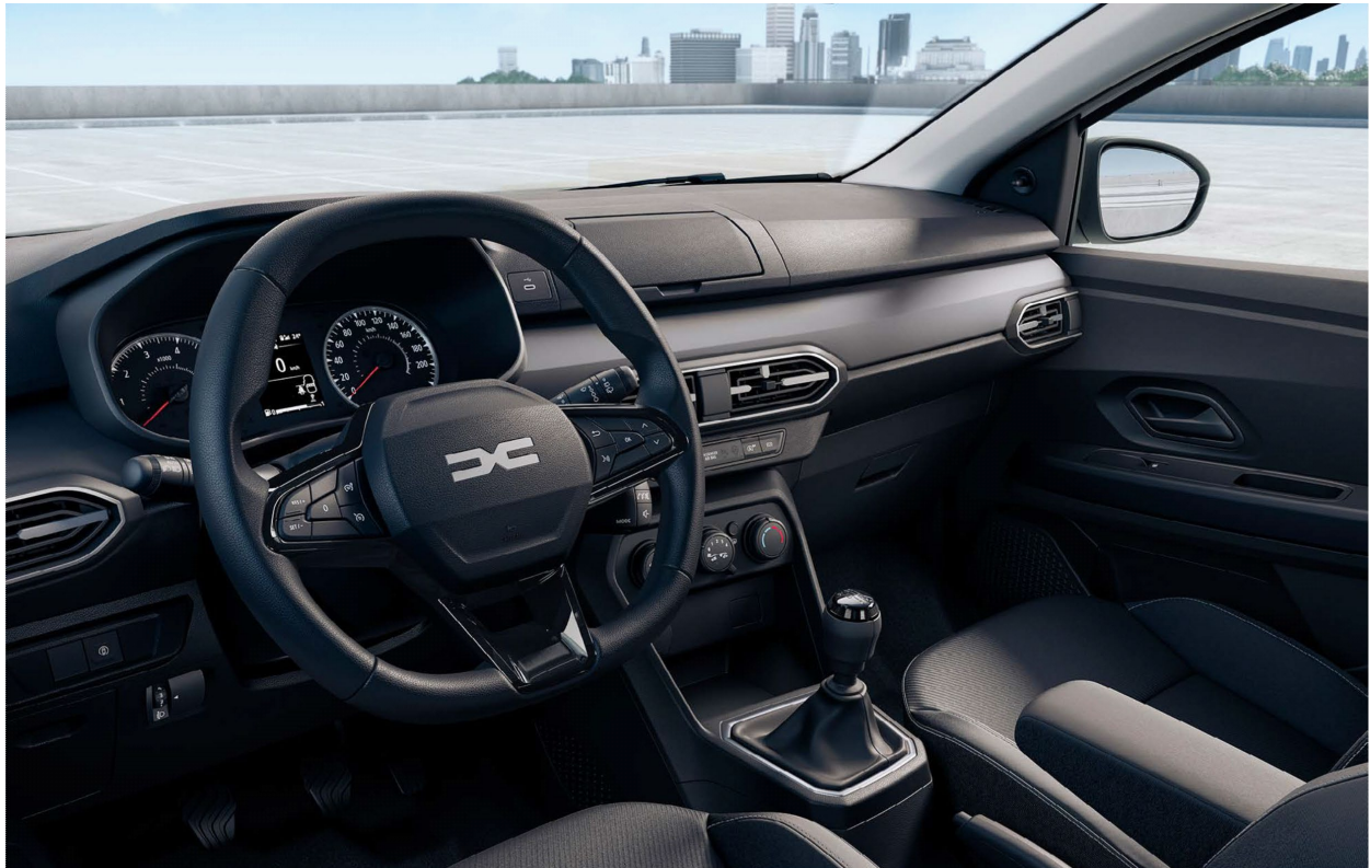
Πίνακας οργάνων με οθόνη 3,5" & Σύστημα πολυμέσων Media Control