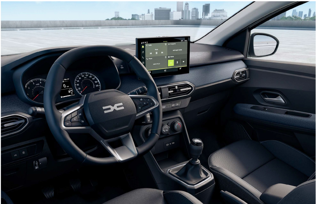
Ψηφιακός πίνακας οργάνων 3,5" & Σύστημα πολυμέσων Media Display 10,1"