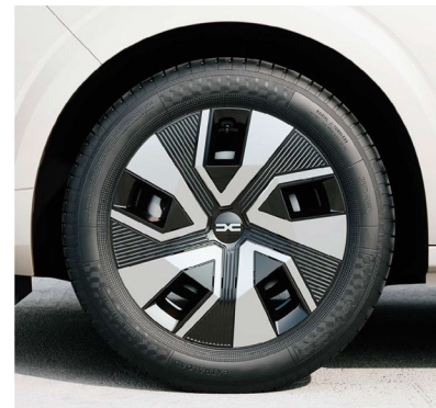
Τροχοί 16" & ελαστικά 195/55 R16