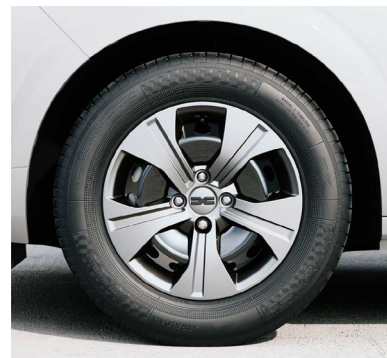
Τροχοί 15" & ελαστικά 185/65 R15