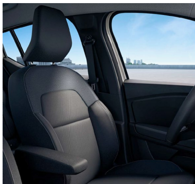
Υφασμάτινες επενδύσεις καθισμάτων